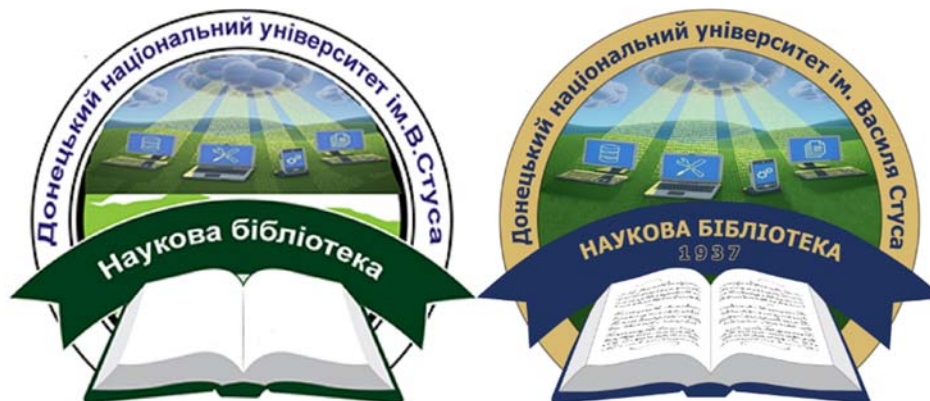
Рис. 1. Оновлений логотип бібліотеки (справа)

Далі, після затвердження вимог, першим етапом є оновлення логотипу, оскільки це візитна картка бібліотеки, яка впливає на перше враження і впізнаваність у соціумі [2].